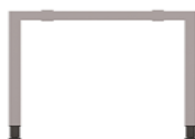
gri argintiu RAL 9006