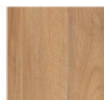
Nuc Pacific 3700